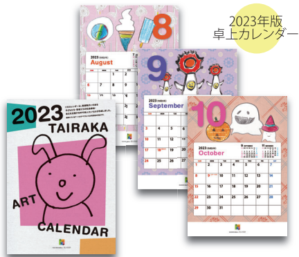
2023年版 卓上カレンダー

個性豊かな作風のオリジナルアート作品をモチーフにした「たいらかアートカレンダー」。早くも2024年版の制作が始まりました。今年はどうなカレンダーが出来上がるでしょうか。どうぞご期待ください。