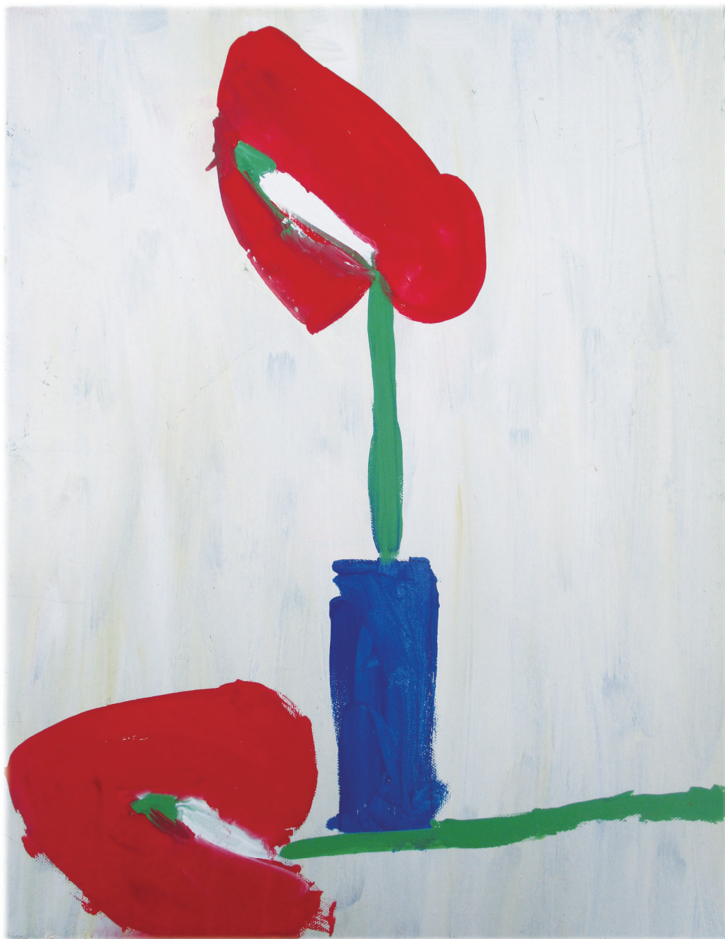
アンズリウム / Art by 花

ひときわ暑い今年の夏をいかがお過ごしでしょうか。コロナ禍明けも束の間、世の中は物々しい状況が溢れ、色々なところで大きく環境が変わろうとしているようです。こんな時こそ、一人一人の多様性に人々の目が注がれ、少しでも「たいらか」な方向へと変わるために、人々の知恵と力が活かされることを強く祈る日々です。