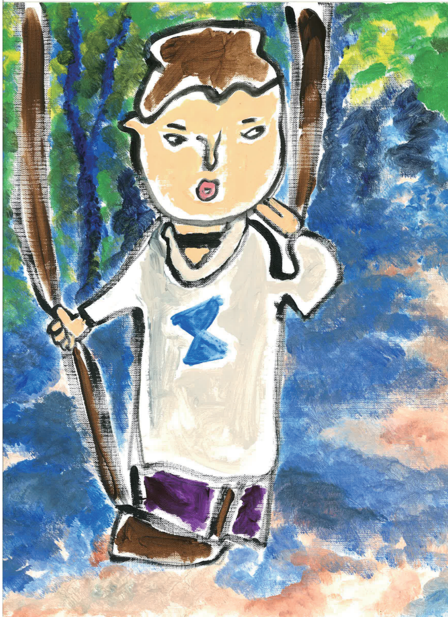
ルノアールの「ぶらんこ」を描いた作品です。丸い顔とぼってりした唇が愛らしく表現されています。木漏れ日の中でぶらんこに乗る女性の姿や、右手にしっかりと握られたブランコの紐など、よく特徴を掴んで描かれています。(ART by 花)

2024年、時代は一段と大きな軋みを立てて、その変化を加速させようとしているようです。でも私たちの祈りはただひとつ、「一人ひとりに、たいらかな明日を」。この思いをしっかりと携えて、これからも歩んでまいります。